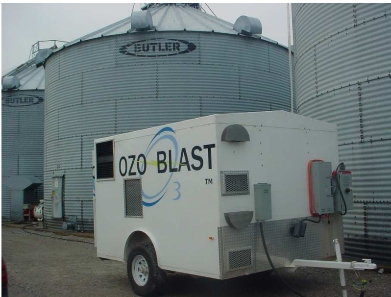
Figura 1: Equipo generador de ozono de gran capacidad (Producido por O 3 Co., Aberdeen, Idaho, EEUU).

Una ventaja sumamente importante del uso del ozono es que una vez que el ozono ha reaccionado, el residuo de dicha reacción es oxígeno. Esto implica la ausencia de contaminantes luego de una adecuada aplicación del gas. Es por ello que se encuentra aprobada para su uso en productos orgánicos en las normativas de países como EEUU.